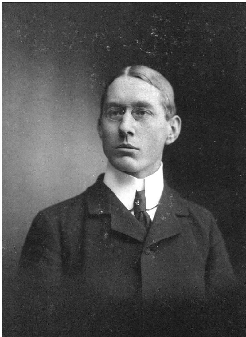
Den unge verdensmand.

Amerika-romanerne Madame d’Ora (1904) og Hjulet (1905) har ikke-danske hovedpersoner i ikke-danske omgivelser (i hhv. New York og Chicago) og kunne som sådan udmærket være kandidater til verdenslitteraturprædikamentet. I danske sammen-