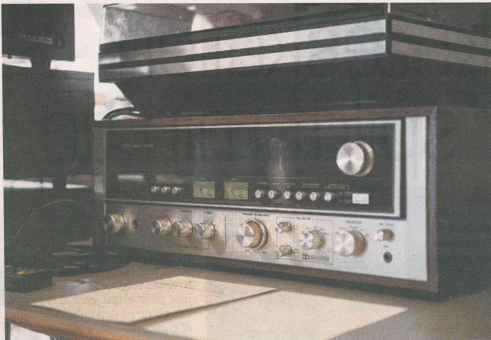
Marantz, Pioneer og Akai er blandt hi-fi-producenterne fra anlæggene "guldalder" - nemlig halvfyrdserne og firserne.