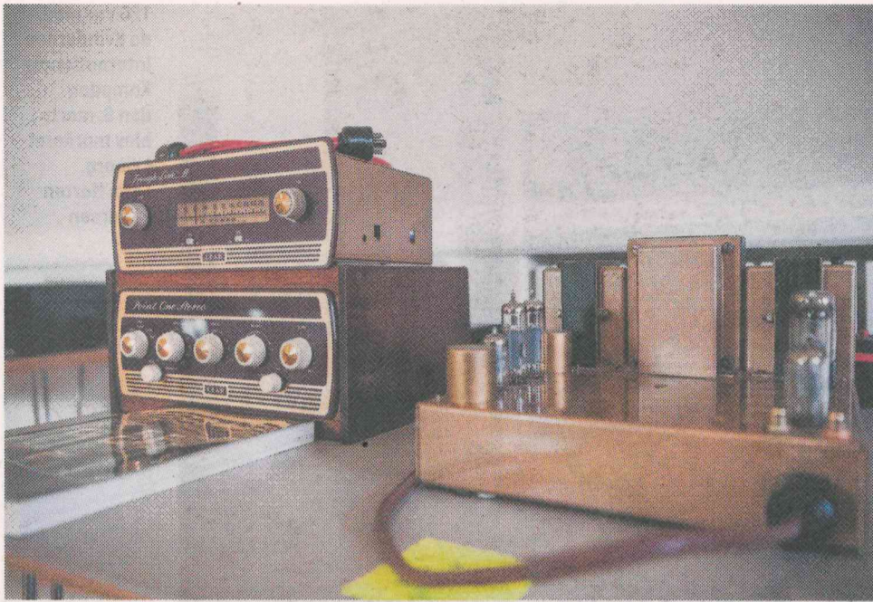
Der var også noget ældre anlæg at kigge på.