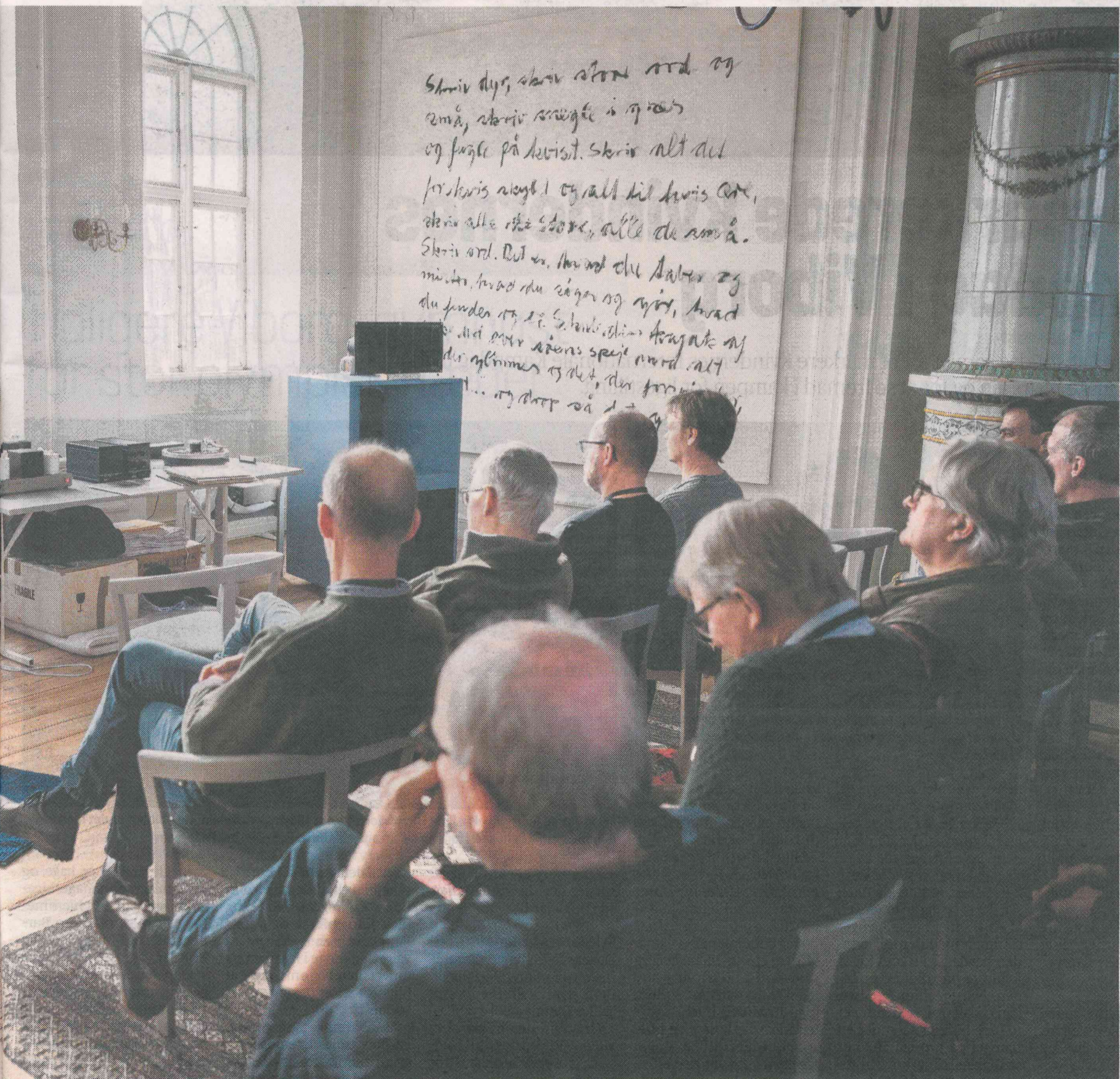
Det er, så man kan høre spyttet i saxofonen, lød det om det her anlæg.

Skriv dig, skriv ston ned og små, skriv smøgtle i og ro og fagle på herist. Skriv alt det forstavis noget og alt til hvis det, skriv alle de store, alle de små. Skriv ord. Det er, hvordan du taler og mister, hvad du siger og siger, hvad du finder og så. Skriv, skriv, skriv og der er, der er, der er, der er, der er der er, der er, der er, der er, der er